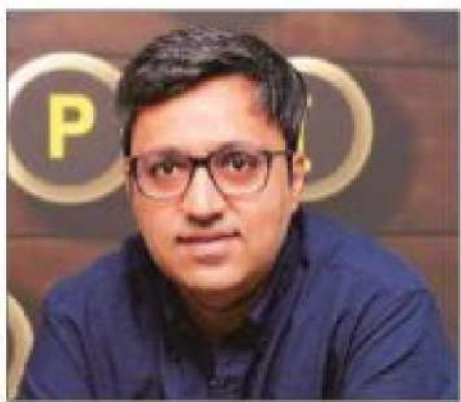
This makes Ashneer Grover one of the highest taxpayers among the founders in the start-up community, for two straight years