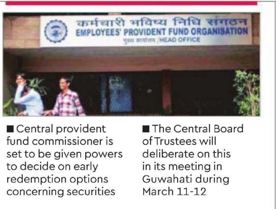
■ Central provident fund commissioner is set to be given powers to decide on early redemption options concerning securities